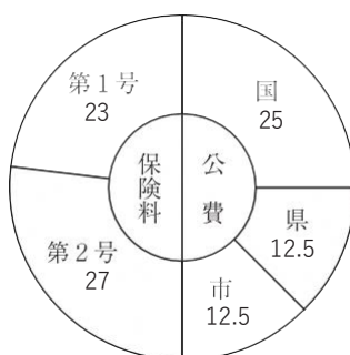
介護予防・日常生活支援総合事業費