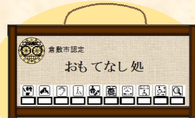
▲認定掲示物イメージ (縦20cm×横35cm)

なお、「おもてなし処」では、対応可能な項目を掲示し、 「おもてなしマイスター」が中心となって接遇を行います。