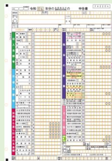
(確定申告書第一表)