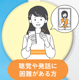
聴覚や発話に 困難がある方