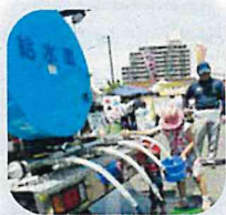
◆ 子どもたちに人気の給水車が 来るよ! 乗車もできるよ!