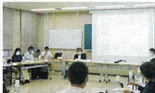
◆審議会の様子 事業計画などの進捗状況を点検・評価していただくとともに活発なご意見をいただきました。

水道局では、水道事業の経営状況を審議する水道事業経営審議会を設置しています。 このたび、委員の任期満了に伴い、水道を利用するお客さまの代表として参加していただける方を公募します。応募方法など詳しくは、広報くらしき5月号および市ホームページに掲載します。 水道を利用するお客さまのご意見をこれからの水道事業に生かすため、皆さんの応募をお待ちしています。