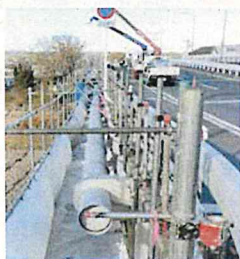
◆水道管の改良工事の様子 古くなった配水管に代わり、 新しい管を橋に添架しています。 (里見橋：玉島阿賀崎)