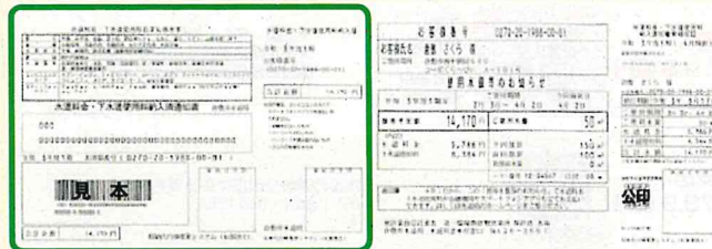
使用水量等のお知らせ兼納入通知書 ※口座振替の方は変更ありません