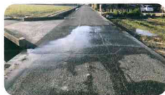
▲雨が降っていないのに漏水で路面が濡れている様子