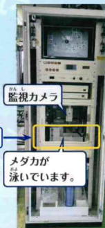
▲バイオアッセイ装置