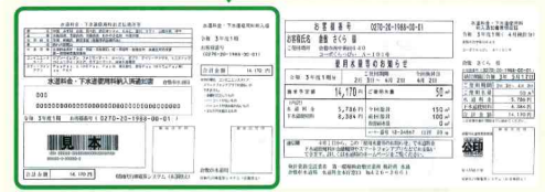
使用水量等のお知らせ兼納入通知書 ※口座振替の方は変更ありません

令和3年4月検計分から「使用水量等のお知らせ」と合わせて「納入通知書」を発行しますので、すぐにお支払いが可能となります。詳しくは、市ホームページをご覧ください。↓