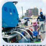
◆子どもたちに人気の給水車が