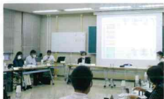
◆審議会の様子 事業計画などの進捗状況を点検・評価していただくとともに活発なご意見をいただきました。

このたび、委員の任期満了に伴い、水道を利用するお客さまの代表として参加していただける方を公募しております。応募方法など詳しくは、広報くらしまし5月号および市ホームページに掲載しています。 水道を利用するお客さまのご意見をこれらの水道事業に生かすため、皆さんの応募をお待ちしています。