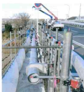
◆水道管の改良工事の様子 古くなった配水管に代わり、 新しい管を橋に添架しています。 (里見橋：玉島阿賀崎)