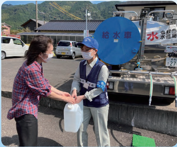
▲仮設給水所で水を手渡す様子