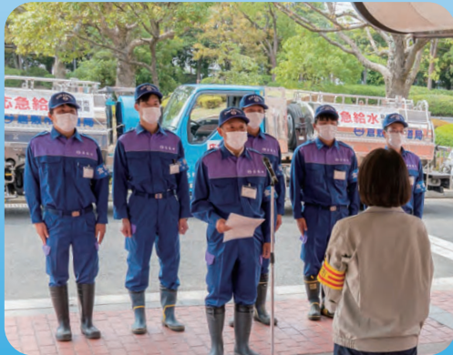
▲出発式で倉敷市長から激励を受ける様子

令和4年9月の台風15号による豪雨により、静岡市では大規模な断水が発生しました。 倉敷市は、平成30年7月豪雨災害において多大なご支援をいただいたこともあり、静岡市に9月26日から10月6日の11日間、倉敷市水道局の給水車2台とのべ職員18人を派遣しました。 現地では、7時から21時まで、高齢者施設への応急給水や仮設給水所での個別給水活動を実施しました。