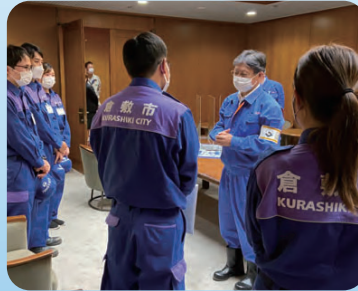
▲静岡市長へ給水活動終了の報告