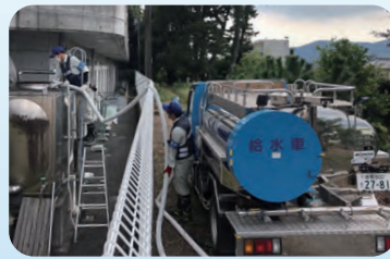
▲高齢者施設への応急給水