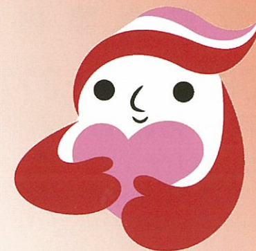
犯罪被害者等支援 シンボルマーク