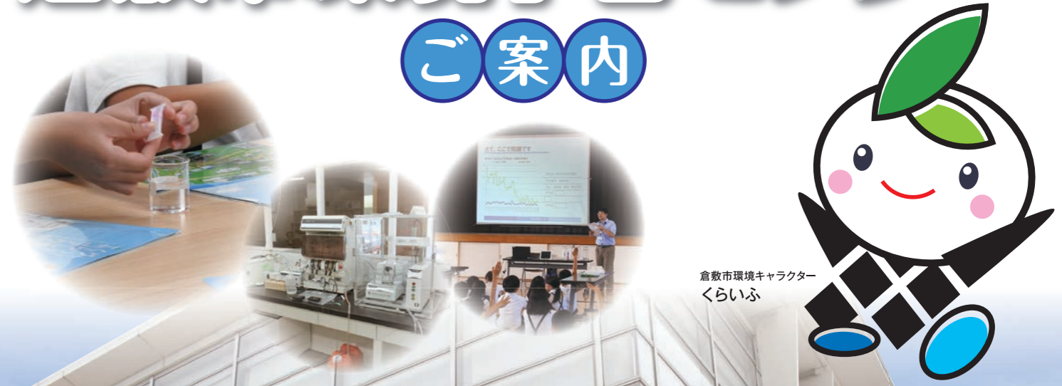
倉敷市環境キャラクター くらいふ