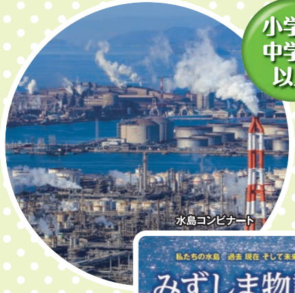
小学生 中学年 以上 約30分 水島の歴史と環境 水島の歴史と環境についてのお話をします。