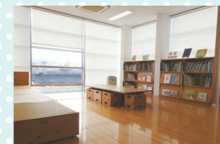
エコライブラリー(図書コーナー) 約2,000冊の環境関連の雑誌や本などを置いています。奥に畳スペースもありますので、ゆったり過ごせます。