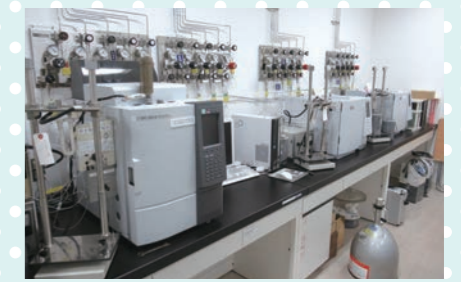
環境監視センター 市内24カ所にある大気測定局で空気の汚れを24時間ずっと測っています。また、市内の川や海など様々な場所で水を採り、汚れや有害物質などを調べています。