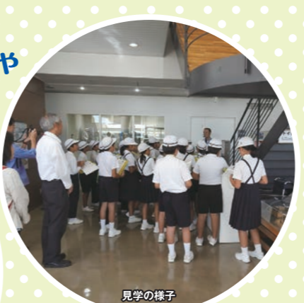
幼児 以上 約30分 施設見学