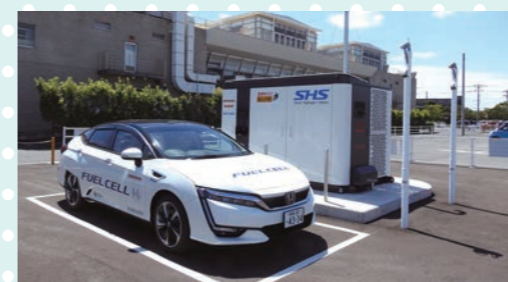
燃料電池自動車、水素ステーション 水と電気から水素を作る水素ステーションとその水素で走る燃料電池自動車を備えています。