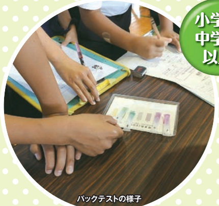
小学生 中学年 以上 約45分 水の汚れを調べよう CODバックテストを用いて水の汚れを調べます。