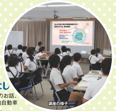
小学生 中学年 以上 約45分 地球温暖化のはなし 地球温暖化の現状についてのお話、水素ステーションや燃料電池自動車(水素自動車)の見学をします。