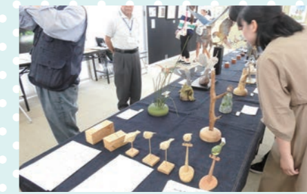
エコギャラリー バードカービングの展示や、緑のカーテンコンテスト、児島湖流域ポスターコンクール参加作品の展示、環境白書ポスター展示など、自然や環境に関する展示などを行っています。