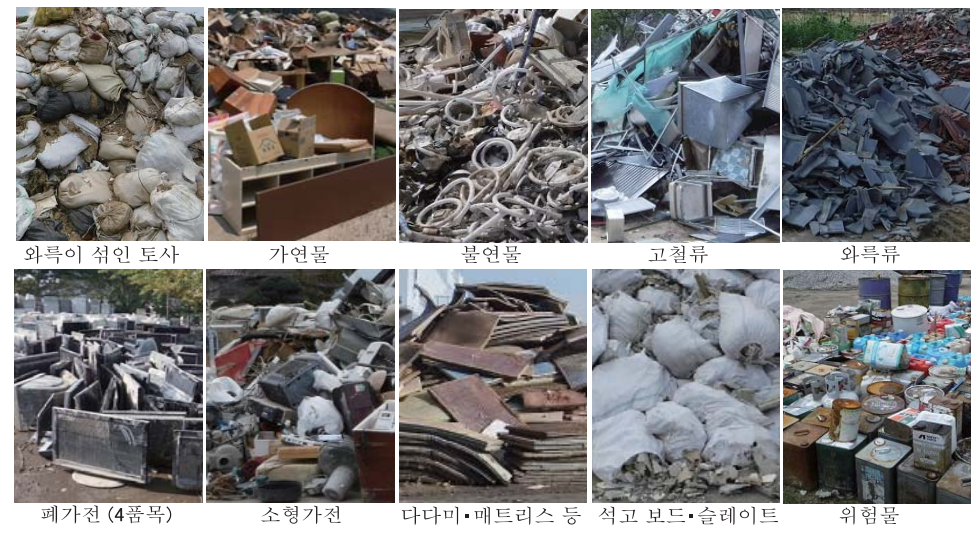
와류이 섞인 토사 가연물 불연물 고철류 와류류 폐가전 (4품목) 소형가전 다다미·매트리스 등 석고 보드·슬레이트 위험물

재해 시에는 여러분에게 불편·폐를 끼쳐 드려 죄송합니다만 한시라도 빨리 재난폐기물을 처리할 수 있도록 이해와 협조를 부탁드립니다.