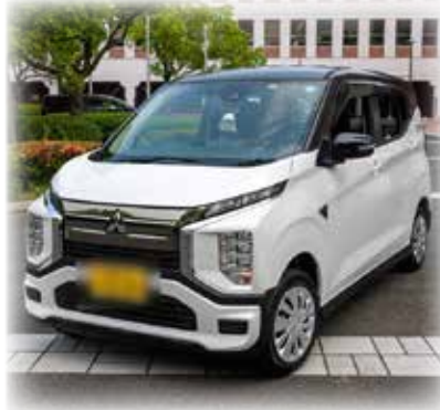
災害時に電力を供給する役割も期待される電気自動車

市のゼロカーボンシティへのチャレンジをPRするステッカーを車に貼ること、災害時に電気自動車を使った避難所などの電力供給への協力をお願いする。原油価格高騰に対する事業者への支援であるため、専ら事業の用に供することが明確な法人事業者を対象としている。