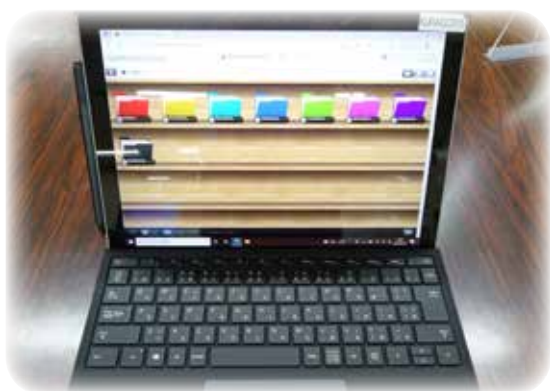
タブレットとしても使用できる議員パソコンとペーパーレス会議システム