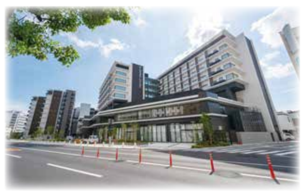
市街地再開発事業で整備された「あちてらす倉敷」

図る土地区画整理事業や、歴史的な町並み保存と将来のまちづくりを担う人材育成に努める。