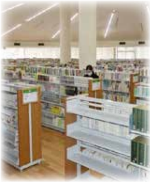
社会教育の拠点として重要な役割を果たしている図書館

図書館も効率的で利用者のニーズに柔軟に対応できる運営が求められている。市民サービス向上と経費削減を両立しながら、市民に喜ばれ、利用しやすい図書館を目指すには、委託による運営も選択肢の一つと考える。