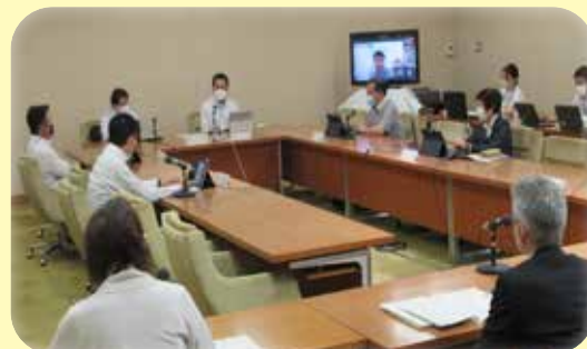
オンライン出席委員がモニターに写し出された市民文教委員会の様子

倉敷市議会では、重大な感染症の拡大や大規模災害に備え、今年2月に、委員会のオンライン開催を可能とする条例などの改正をしています。