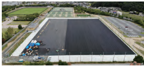
人工芝の敷設など、サッカー・ラグビー場の整備が進められている水島緑地福田公園

令和4年度中の供用開始を目指し、陸上競技場跡地に人工芝のサッカー・ラグビー場を整備中。また、天然芝のサッカー・ラグビー場は、令和5年度中の供用開始に向け、外周に防球ネットを整備中。令和5年度以降は、スポーツ施設周辺の園路などの整備を進め、市民に快適なスポーツ環境を提供する。