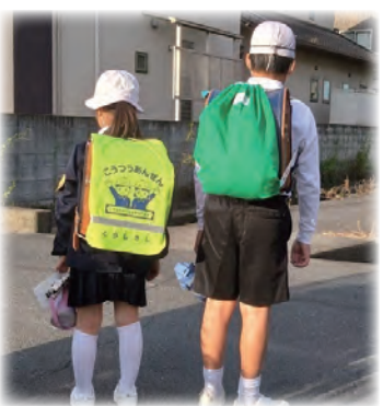
ランドセルのほかにたくさんの荷物を持って登校する小学生

携行品に係る配慮についての国からの通知を受け、持ち帰る物と学校に置く物を工夫するよう各学校に通知し、児童・生徒の負担軽減を踏まえた指導を行っている。引き続き、児童・生徒の安心・安全な通学を指導する。