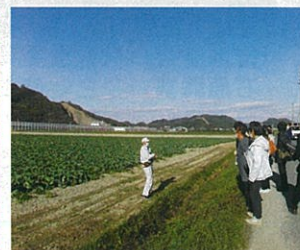
キャベツのほ場 (有)エーアンドエス