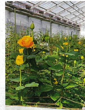
バラ (樹大内ファーム)

学んだことを活かし、地域の特性を考えながら、今後も研鑽を積んでいきたいと思えます。