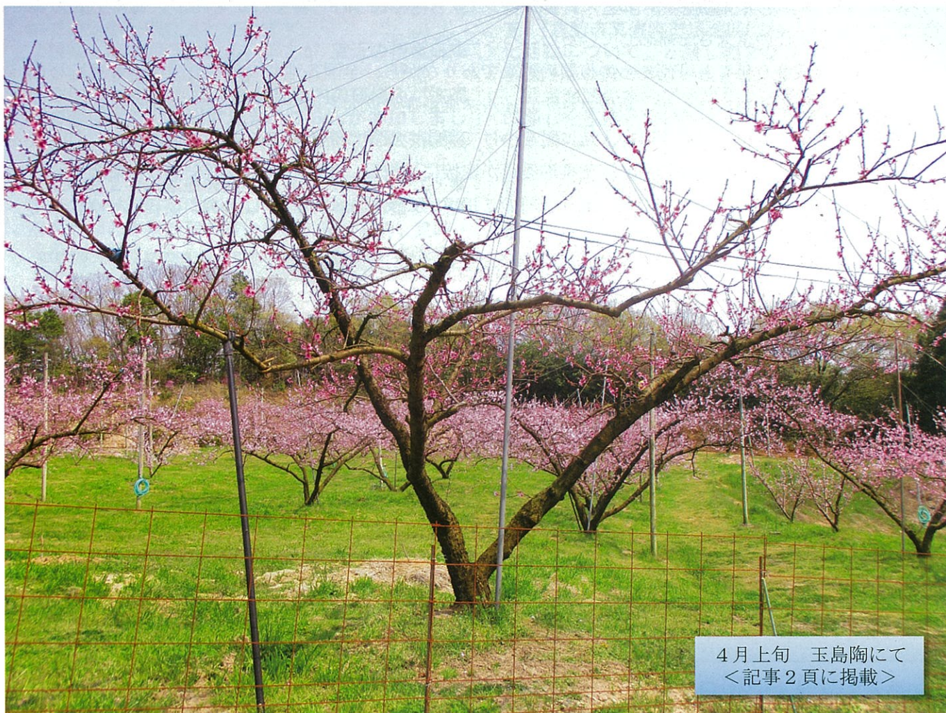
4月上旬 玉島陶にて <記事2頁に掲載>