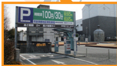
⑤ 美観地区南駐車場