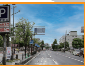
④ 倉敷市中央駐車場