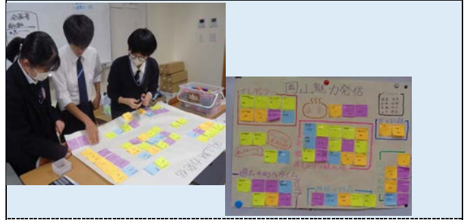
9月～10月 メニュー開発・展示コーナーの企画・立案