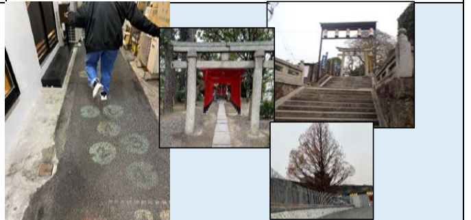
12月19日 他 マップ作成のための写真撮影