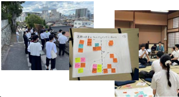
8月25日 暮らし・き・になる エリアプラットホーム ユースセッション参加