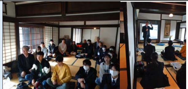
12月16日 暮らし・き・になる 講演会&ユースセッション 参加