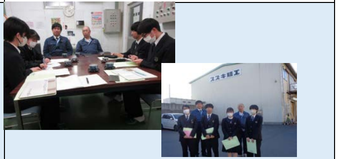
1月11日 スズキ麺工株式会社 訪問