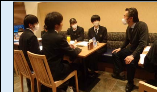
12月11日 吉備サービスエリア（株式会社ルートサービス）訪問 企画提案