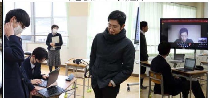
PR戦略の修正・見直し（オンライン/対面）