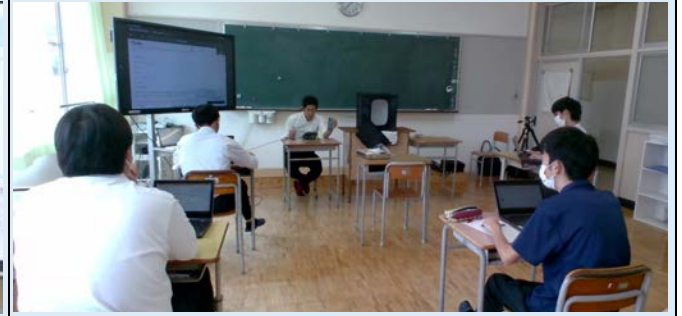
PR方法考案／講師（カメラマン）による添削