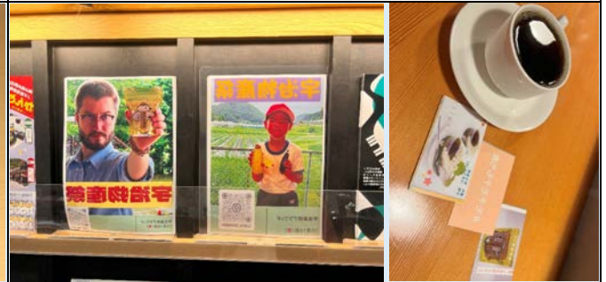
ポスターの作成・近隣施設へのPR協力依頼