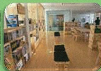
エコライブラリー

環境団体・地域の団体 そのほかにも、たくさんの団体が、いろい ろな自然にふれる活動を行っています。