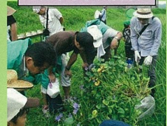
ミズアオイの観察会

倉敷市には、生き物をまもるために活動している人たちや、多くの人に生き物について知ってもらおうと活動している人たちがいます。こうした活動のおかげで、絶滅が心配されている生き物がまもられていたり、希少な生き物を含め、生き物を好きになる人たちが増えていきます。