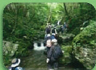
リポートレッキング

自然にふれるイベントを行っています。 環境や自然の本がたくさんある図書館 (エコライブラリー)もあります。