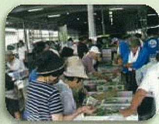
おいしいマスカットがいっぱい！