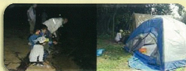
無人島キャンプでウミホタルを観察！(笠岡市梶子島)

倉敷市立自然史博物館友の会と協力しながら、 倉敷市内はもちろん、いろいろな所に出 かけて自然観察会を行っています。