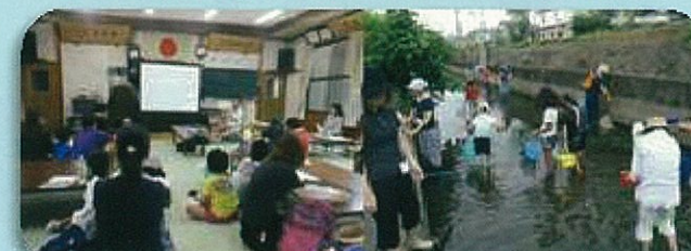
八間川調査隊(水質のお話・生き物さがし) (主催：みずしま財団)

環境団体・地域の団体 そのほかにも、たくさんの団体が、いろい ろな自然にふれる活動を行っています。