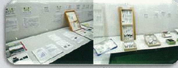
しぜんしくらしき賞作品展

自然についての標本や研究の作品を募集し表彰・ 展示しています。小学生のみなさんからも、毎年たく さんの応募があるよ！(倉敷市立自然史博物館友の会)