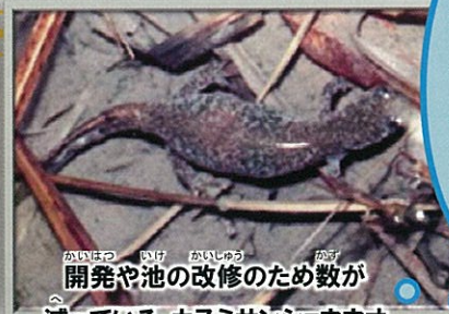
開発や池の改修のため数が減っている カスミサンショウウオ