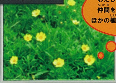
オオキンケイギク