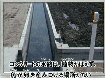
コンクリートの水路は、植物がはえず、魚が卵を産みつける場所がない