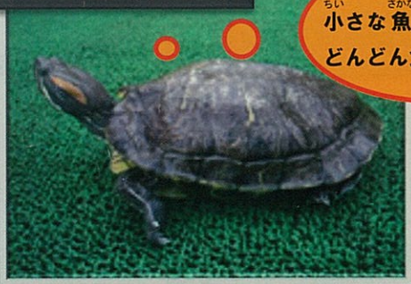
ミシシippアカミミガメ (ミドリガメ)