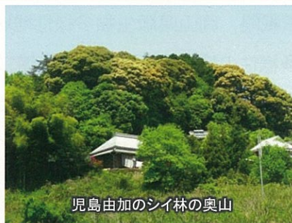
児島由加のシイ林の奥山