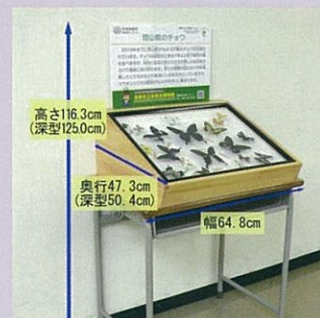
倉敷市立自然史博物館の標本を貸し出す「倉敷まちかど博物館」