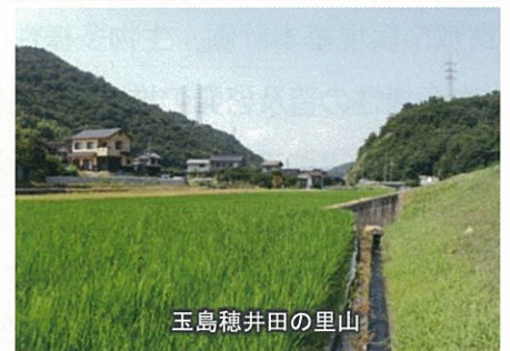
玉島穂井田の里山

森林、里地里山、河川、湿原、干潟、アマモ場など、いろいろなタイプの自然が存在すること。 それぞれの自然環境のもとに、多様な生物が織りなす系（システム）が形成されています。倉敷市も瀬戸内海や高梁川、多くの用水路やため池、平野の周りには丘陵地と多様な生き物の棲み場が存在しています。