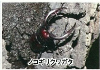
ノコギリクワガタ