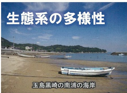
玉島黒崎の南浦の海岸