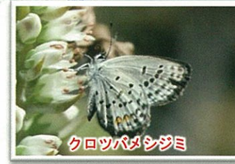
クロツバメシジミ

学校などの教育施設や公園の緑地やピオトープなどは、環境学習の場として利用されるほか、宅地や事業所、街路などを含め、市街地の緑は地域の樹種による植栽がなされ、生物多様性の保全に寄与するエコロジカルネットワーク（生き物たちが移動する道）の一部を担っている。