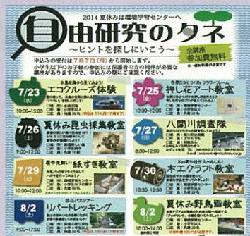
倉敷市環境学習センター主催の環境体験学習エコサマースクール