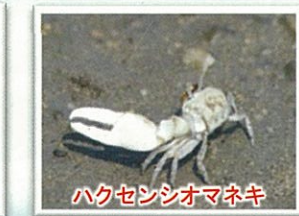
ハクセンシオマネキ