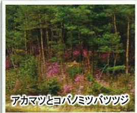
アカマツとコバノミツバツツジ