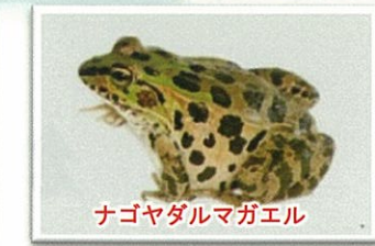
ナゴヤダルマガエル