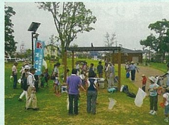
倉敷みらい公園の生き物しらべ