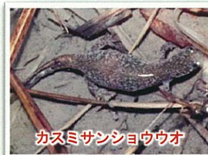
カスミサンショウウオ

市民団体と行政の協働する行事や事業者によるCSR活動として、森林ハイキングや野鳥観察、秋にはキノコ狩りなどの他、間伐体験などが開催されており、そこには多くの市民が参加し、自然とそこからもたらされる恵みを楽しんでいる。