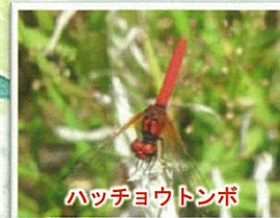
ハッチョウトンボ

ため池は、適切な管理により外来生物が排除されており、秋には池干しが行われ、大人も子どももフナやスジエビ採りを楽しむ。改修により防災や利水の機能が強化されているだけでなく、自然環境にも配慮され、オニバスやガガブタが咲き、ウチワヤンマやシオカラトンボ、チョウトンボが飛び回り、水中ではタガメがメダカを狙っている。池のほとりでは在来カメが甲羅干しをしており、早春には、林内から産卵のためカスミサンショウウオが訪れる。