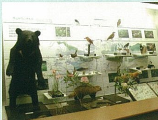
倉敷市立自然史博物館の展示

中国四国地方唯一の市立自然史博物館である「倉敷市立自然史博物館」を核に、関係者、市民に生物多様性に関する情報を広く提供し、生物多様性の保全、回復、再生に役立てる。