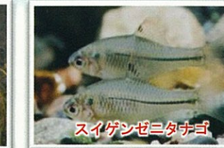
スイゲンゼニタナゴ