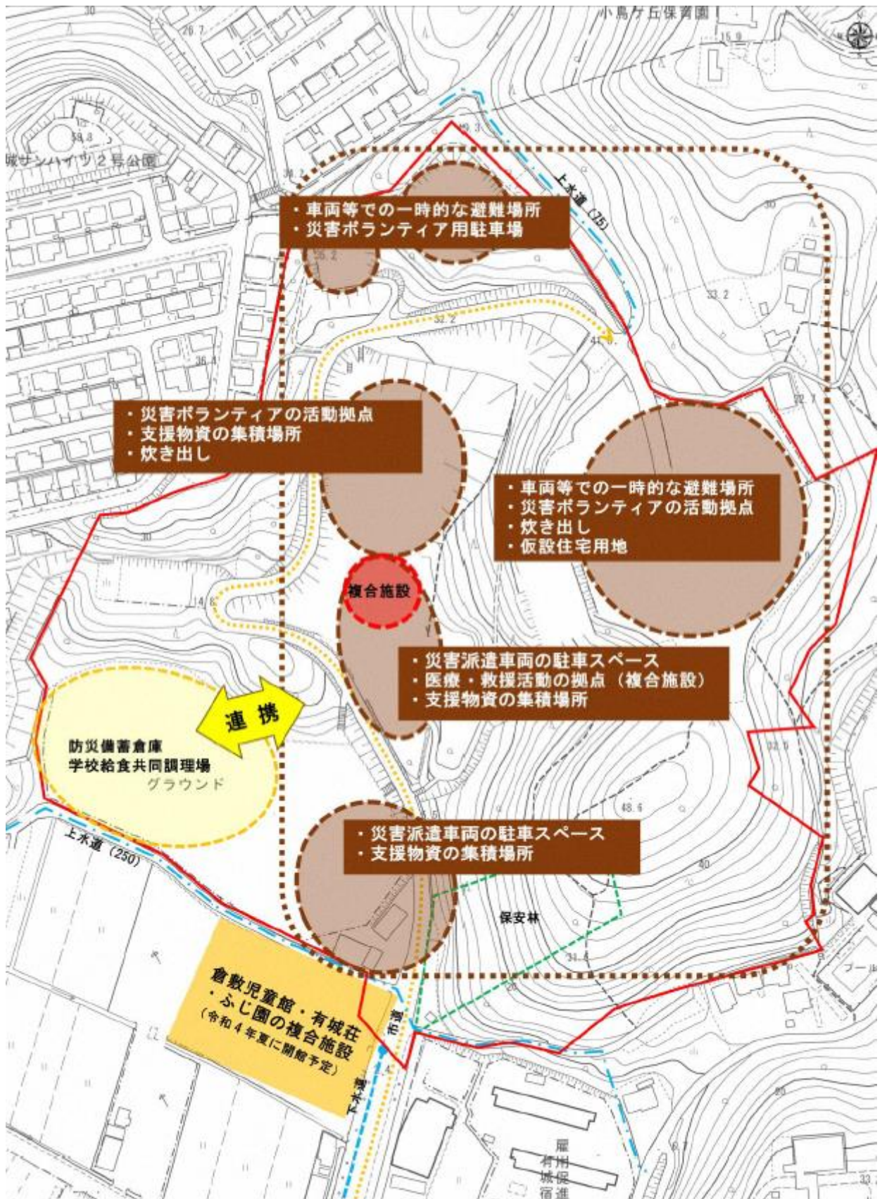
図 3-2 事業敷地の災害時ゾーン区分 (案)