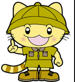
倉敷市税キャラクター タックス隊長

本庁税制課 (2階4番窓口 Tel.426-3175) 児島税務事務所 (児島支所1階 Tel.473-1118) 玉島税務事務所 (玉島支所1階 Tel.522-8117) 水島税務事務所 (水島支所1階 Tel.446-1610) 真備支所市民課 (真備支所1階 Tel.698-8115) 船穂支所市民課 (船穂支所1階 Tel.552-5100) 庄支所市民係 (Tel.462-1212) 茶屋町支所市民係 (Tel.428-0001)