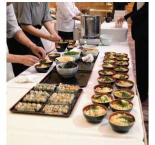
令和元年の交流会風景

日時： 令和5年11月14日（火）19時00分～21時00分 場所： ルポール麹町 2階「ロイヤルクリスタル」 東京都千代田区平河町2-4-3 TEL03-3265-5365 参加費： 7,000円