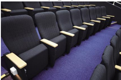
広くて余裕のある座席