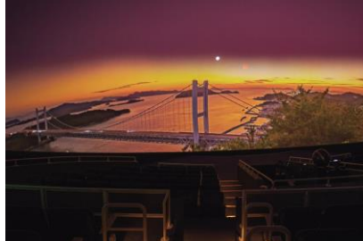
超高精細 10K 映像