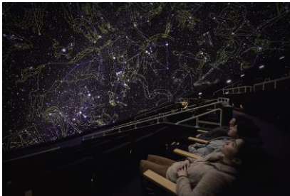
次代に進化したプラネタリウム