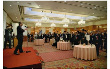
昨年度の交流会風景

日 時： 平成30年11月14日（水） 午後6時30分～8時30分 場 所： ルポール麹町 2階「ロイヤルクリスタル」 東京都千代田区平河町2-4-3 TEL03-3265-5365 参加費： 7,000円