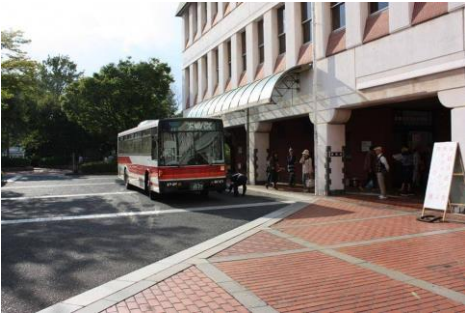
倉敷市役所正面玄関前ロータリー

倉敷市内の美観地区、ジーンズストリートのある児島地区、玉島地区の観光施設は通常通り営業を行っております！