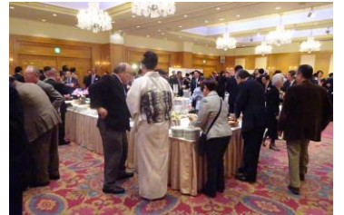
昨年度の交流会風景

日 時： 平成29年11月15日（水） 午後6時30分～8時30分 場 所： ルポール麹町 2階「ロイヤルクリスタル」 東京都千代田区平河町2-4-3 TEL03-3265-5365 参加費： 7,000円