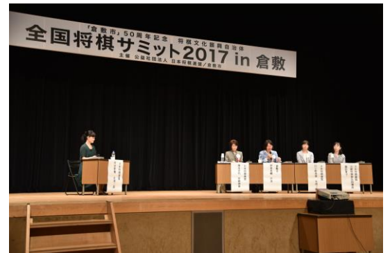
パネルディスカッション「女性への将棋普及」