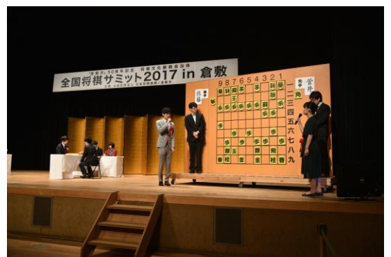
スペシャル早指し対局