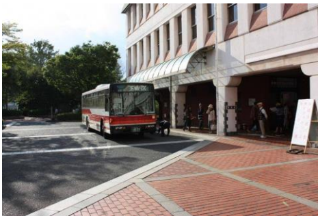
倉敷市役所正面玄関前ロータリー

秋の観光シーズンに合わせて、倉敷市役所屋内駐車場等を開放し市役所から美観地区まで無料シャトルバスを運行しています。