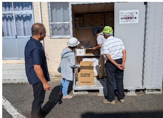
防災備蓄倉庫の確認

まだ、備蓄倉庫を開けて中を確認し、十分な数がないことや、発電機はあっても、ガソリンは備蓄されていないこと、箱のなかに何が入っているのか分からないなど課題に気がされました。