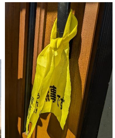
黄色いタスキ訓練