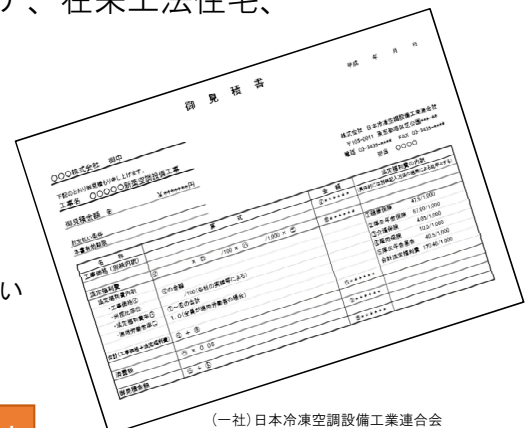
(一社) 日本冷凍空調設備工業連合会