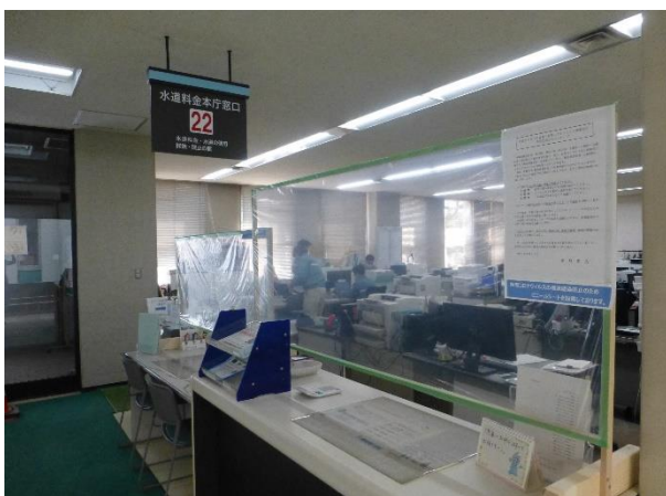
▲窓口に設置した透明パーテーション