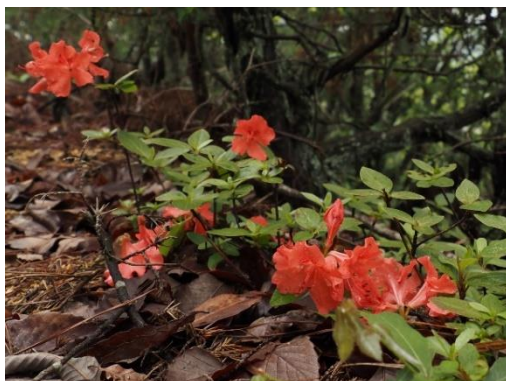
高さ約0.2mで開花するヤマツツジの株。

植物のかたちの特徴は、しばしば図鑑に書かれている以上の変異に富んでいます。今回の特別展では各植物種の高さについて、可能な限り倉敷市内での実際の値を紹介しています。展示や図録をとおして、倉敷の野山の植物の姿を知り、楽しんでいただけたら幸いです。