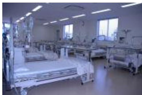
上：当院外観 下：透析室