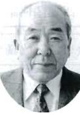
玉島 宮原 明 農政