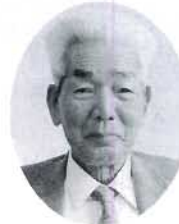
藤戸 粒江 花巻 農地