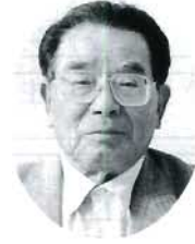
玉島 桑木千萬人 農政