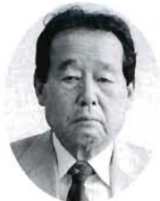
大高 万寿 節雄 農地