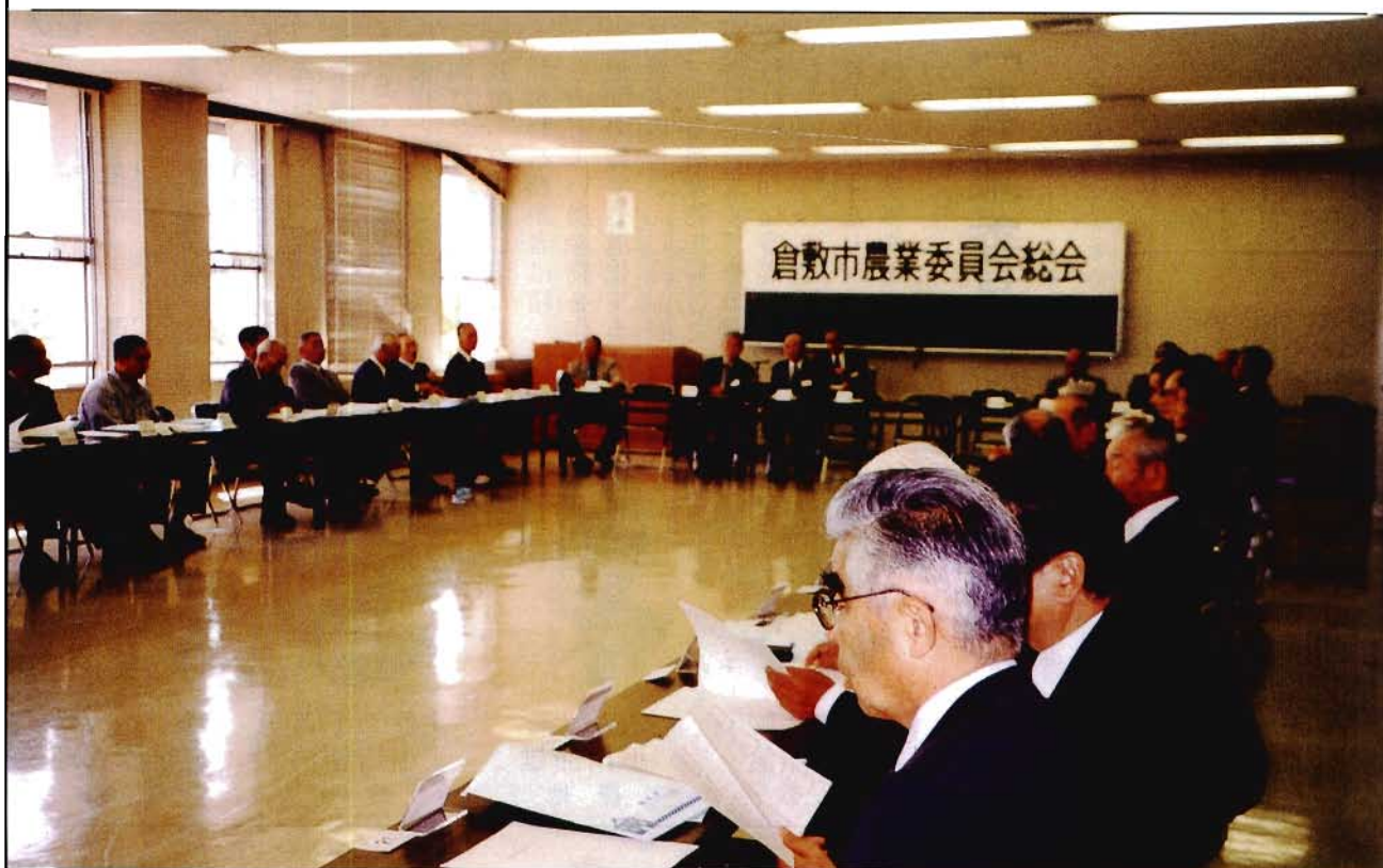
▲倉敷市農業委員会総会開催風景（倉敷市本庁 水道局庁舎3階会議室）

発行 倉敷市農業委員会 編集 倉敷市農業委員会事務局 ☎ (086) 426-3895