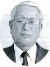
富田 本地 昭 農地