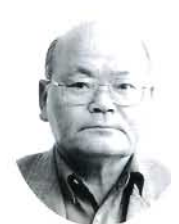
福田 岡本 進 農地