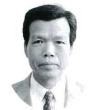
福田 三宅 寛 農政