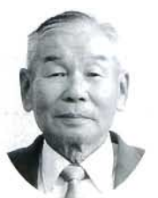
連島 柳井 雅 農政