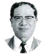
黒崎 中藤定光 農地