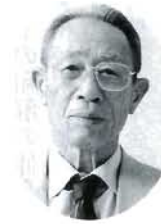
長尾・穂井田 大松 豊 農政