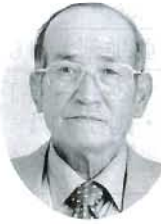
玉島 滝澤 紀 農地