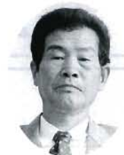
阿知 西洲 守 農地