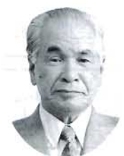
中庄 菅生 豊 農政