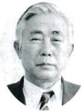
庄 山崎 肇 農政