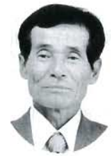
長尾・穂井田 岡田弘希 農地