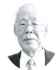
中庄 菅生 輝雄 農地