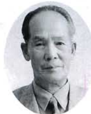
藤戸 粒江 留治 農政