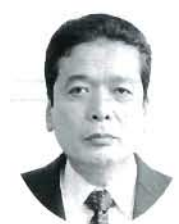
岩 知 榮司 農政