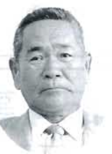
豊洲 帯江 荒木 農政