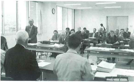
篠山市での研修風景（第一班）

倉敷市農業委員会では、昨年十一月十四日から十五日、及び十六日から十七日の二班に分かれて先進地視察研修を実施いたしました。 農業従事者の高齢化と担い手の減少等により、遊休農地が増加し農地の荒廃化が問題となっております。 そのため、今回の視察研修では遊休農地の対策を積極的に行なっている農業委員会を訪問し、視察研修させていただきました。