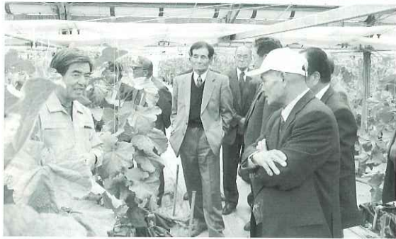
西島園芸団地での施設見学（第二班）

倉敷市農業委員会では、昨年十一月十四日から十五日、及び十六日から十七日の二班に分かれて先進地視察研修を実施いたしました。 農業従事者の高齢化と担い手の減少等により、遊休農地が増加し農地の荒廃化が問題となっております。 そのため、今回の視察研修では遊休農地の対策を積極的に行なっている農業委員会を訪問し、視察研修させていただきました。