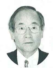
玉島第2・船穂 (長尾・穂井田) 小野健児 農地