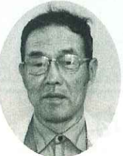
倉敷第3 (庄) 秋山雅俊 農地