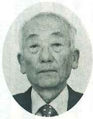
玉島第2・船穂 (富田) 田村 保 農地