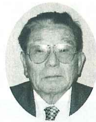
玉島第1 (玉島) 桑木千萬人 農地