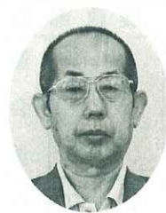
水島 (連島) 三宅佐甫 農地