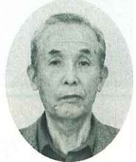
倉敷第2 (中洲・西阿知) 板谷光夫 農地