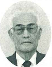
水島 (福田) 白神明治 農政