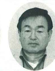
真備 (真備) 間野正之 農地