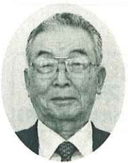
岡山西 畑野 豊 農地