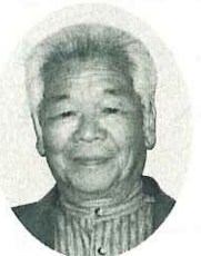
水島 (福田) 能登俊光 農地