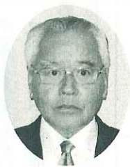
児島 (郷内) 三澤一夫 農地