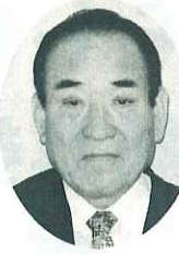
倉敷 三宅 通 さや 政 倉敷 農