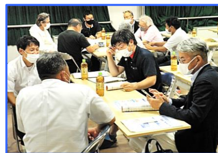
児島地区/児島支所(R4.7.1)

地区研修会では、大変多くの少年補導委員の皆様方にご出席をいただき、中学校ブロックごとの情報交換のほか、少年補導委員の顔合わせや連絡先の交換を行いました。また、倉敷・水島・児島・玉島警察署生活安全課をはじめ、倉敷少年サポートセンターの方にご出席を賜り、管内の青少年に関する状況や岡山県内の少年非行概況など、今後の補導活動に生かせる内容をお話いただきました。