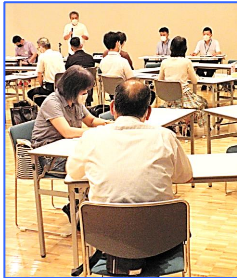
玉島地区/マービーふれあいセンター (R4.7.14)