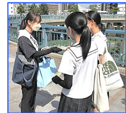
◀夏季休業中の合同補導 長い夏休みを迎え、倉敷市内4地区で「万引き防止キャンペーン」を実施。 (R4.7.20)