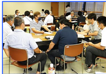
水島地区/水島支所(R4.7.20)