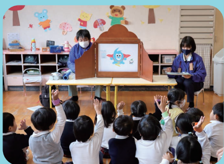
▲紙芝居（倉敷東幼稚園）