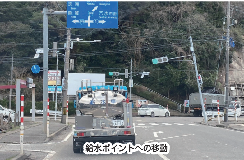
給水ポイントへの移動