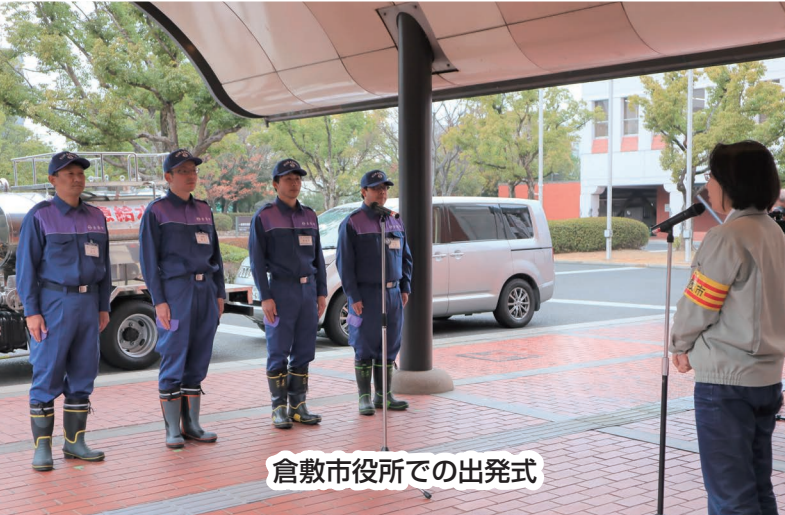
倉敷市役所での出発式