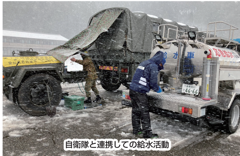
自衛隊と連携しての給水活動