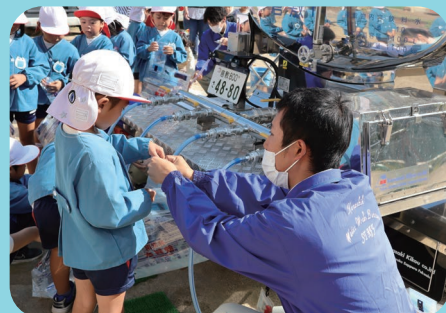
▲給水車から給水パックに注水 （郷内幼稚園）