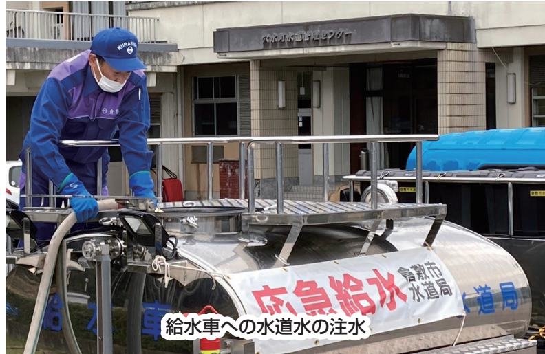
給水車への水道水の注水