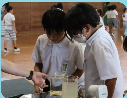
▲水質実験（天城小学校）