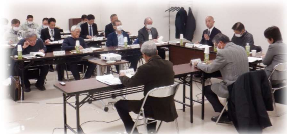
1月11日（木）審議会の様子