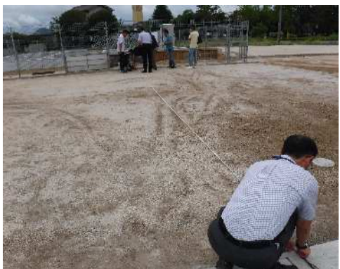
お引き渡しの様子

お引き渡しする際は、権利者の皆様に現地にお越しいただいて、既にお渡ししている仮換地指定通知の添付図面をもとに、土地の形状や寸法等を確認していただきます。