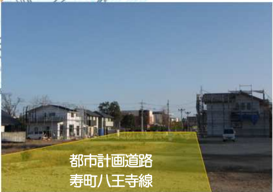
都市計画道路 寿町八王寺線

日吉町では、昨年、7件の建物調査を行いました。 今年も、順次、公共施設整備工事、建物調査を行ってまいりますので、「理解」と「協力」をよろしく願います。なお、計画に変更等がございましたら、随時お知らせしていきます。