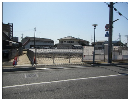
場所は裏面でご確認ください

換地先で最初の新築工事が3月から始まりました。6月には、鉄骨造の3階建てアパートが完成予定です。