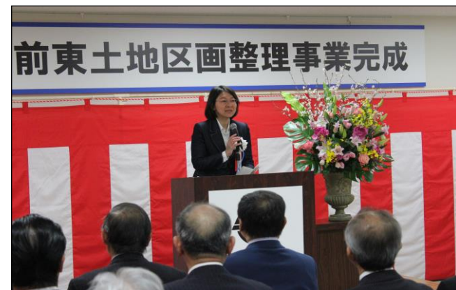
前東土地区画整理事業完成

完成に至るまでの道のりを振り返りつつ、地域活性化や広域交流の拠点にふさわしい街並みに生まれ変わった駅前東地区の事業完成を祝いました。