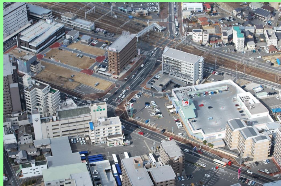
完成後の事業区域の上空から