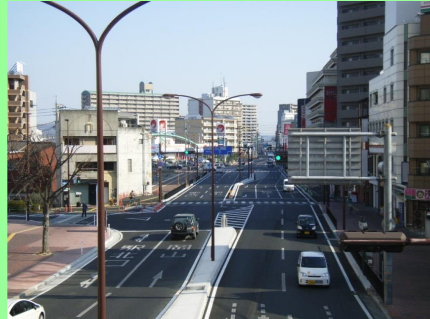
拡幅された国道429号