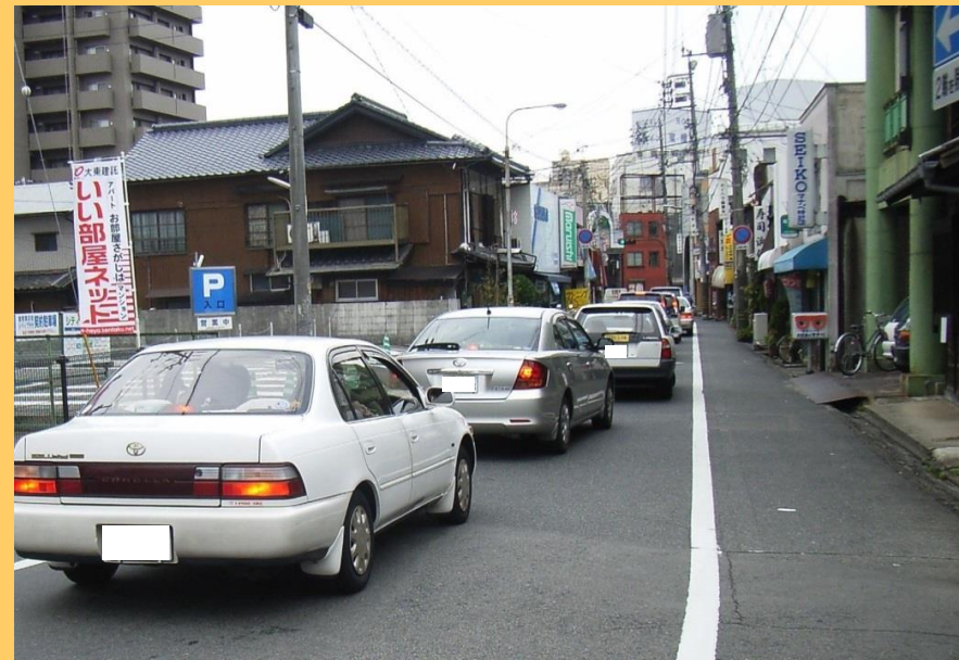
渋滞する倉敷清音線 (平成20年3月)