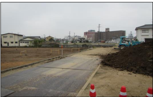
寿町石見線の水路工事の着手状況