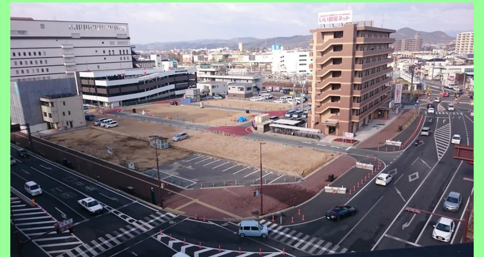
完成した事業区域