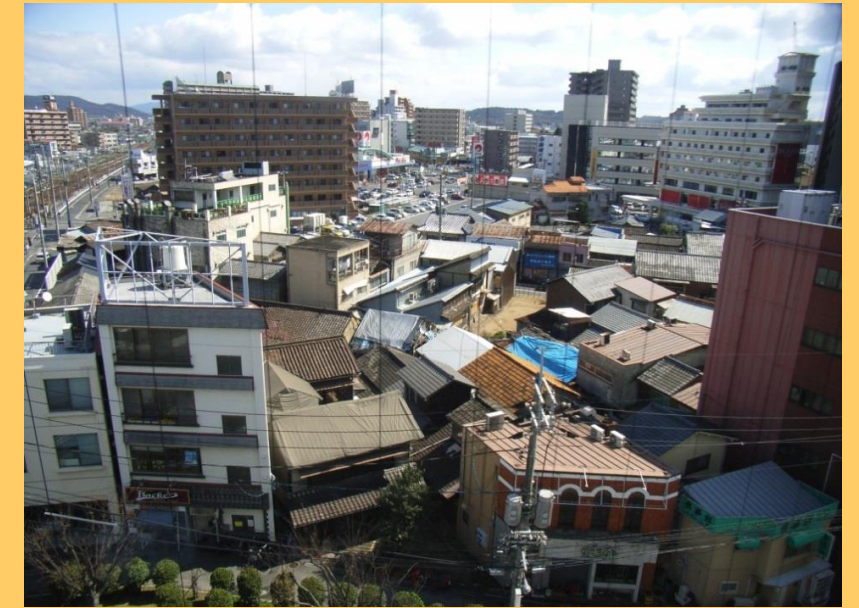
密集した木造家屋 (平成20年3月)