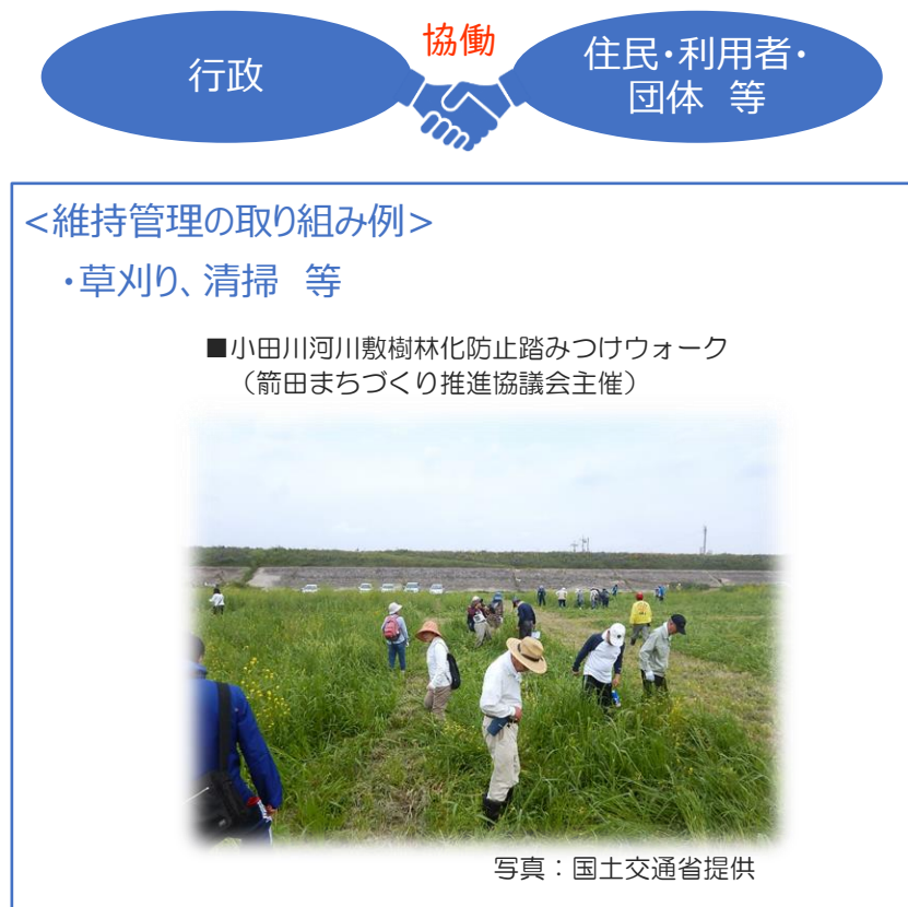
図-5 維持管理の方針イメージ