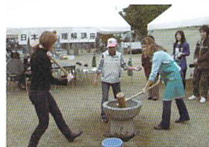
1月開催 【日本のお正月を体験！】