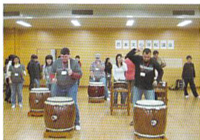
11月開催 【和楽器体験～和太鼓に挑戦～】

外国人市民に、日本文化の体験を通じ地域行事等を理解してもらうことを目的に、多文化共生事業の一環として、日本文化理解講座を開催しました。