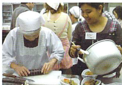
12月開催 【日本料理～お寿司をつくろう～】