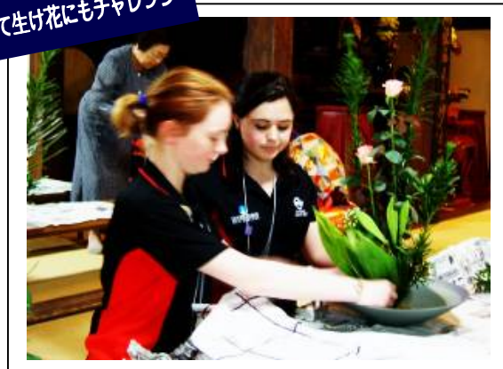
集中して生け花にもチャレンジ