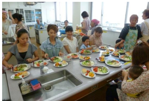
ソーメン&サラダパン：コラボ