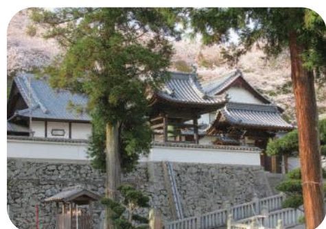
きんぼうじ 〈金峯寺〉

下二万矢形にある村社。稲荷宮 も合祀。伊子御子神社から明治 初年に下二万神社と名称変更 された。祭神は棚織姫命。 1677年に建立。