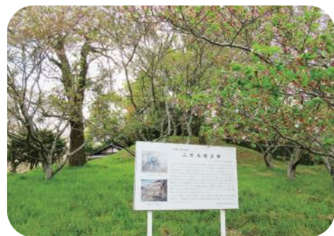
にまおつか 〈二万大塚古墳〉

横穴式石室をもつ 前方後円墳。全長 38m。6世紀中頃 の築造と考えられ る。春には桜が美 しい。