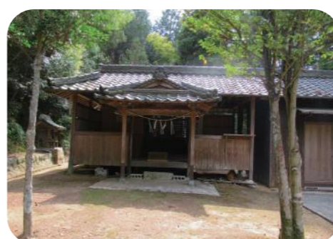
しもにま 〈下二万神社〉

下二万矢形にある村社。稲荷宮 も合祀。伊子御子神社から明治 初年に下二万神社と名称変更 された。祭神は棚織姫命。 1677年に建立。