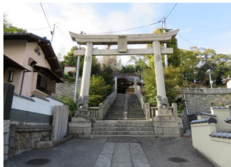
⑥ 金刀比羅神社鳥居