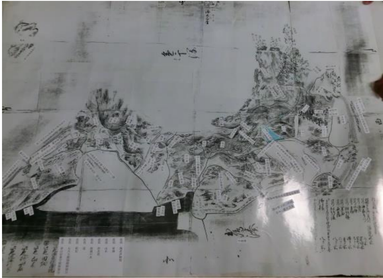
備中國浅口郡乙嶋村絵図(江戸時代中頃)九州大学所蔵 (村高883石3斗8升6合)