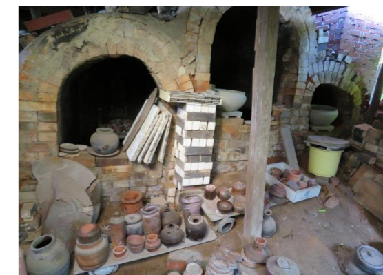
⑨ 備前焼城窯(香西三樹工房) 側面から見た窯