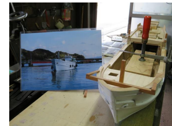
⑩ 加瀬野造船所建造の船(写真) 海に浮かんでいる写真の船の模型を制作中