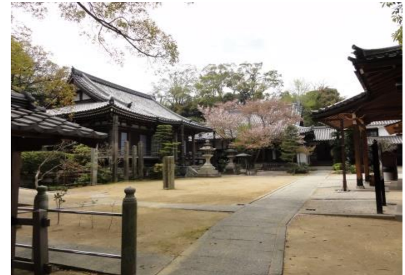
たましまやまあんぶくじょういん(たまだに) ⑤ 玉嶋山安福寺圓乘院(玉谷)