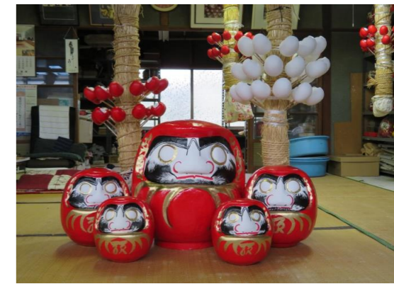
⑧ 玉島だるま虎製造所 制作完了のだるまと乾燥中のだるま