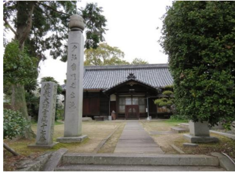
るりさんかいがんじょうじょういん ③ 瑠璃山海岸寺常照院