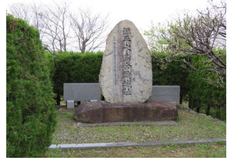
③ 源平水島合戦碑(常照院境内)