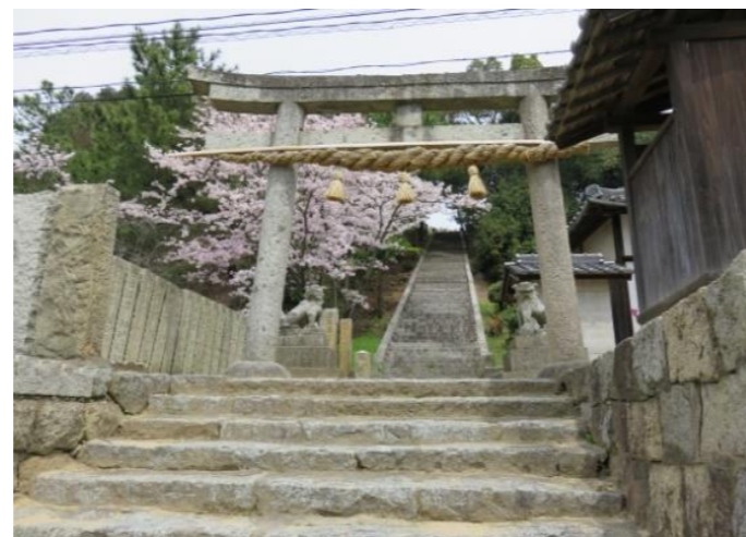
はちまんやま ② 八幡山神社鳥居