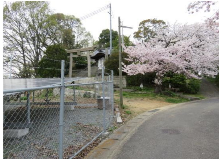
はしくら ④ 箬蔵神社