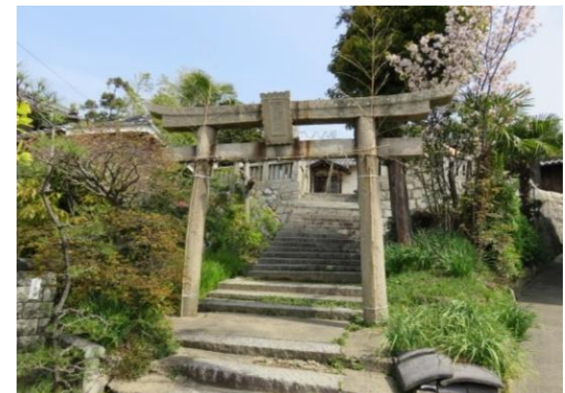
こうじんじゃ ⑦ 荒神社鳥居