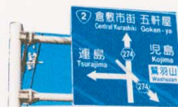
⑩ 道路標識を 目印に!