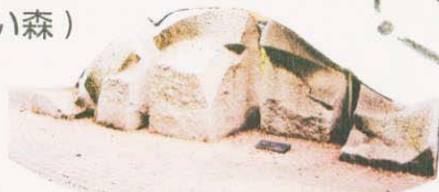
⑦ 臨海記念彫刻(水の化石)