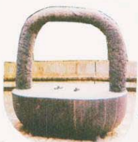
⑧ 臨海記念彫刻 (朝)