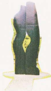
② 臨海記念彫刻 (水の精)