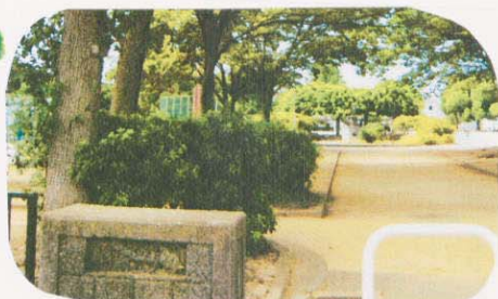
① 水島寿町公園へゴール!!