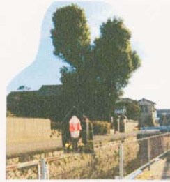
④ クスノキとお地蔵さま