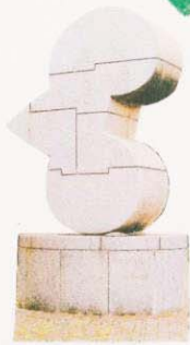
④ 臨海記念彫刻 (MATA NA)