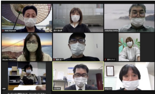
コロナ禍で集まって話し合うことが難しいなか、オンラインも活用して検証を続けました。