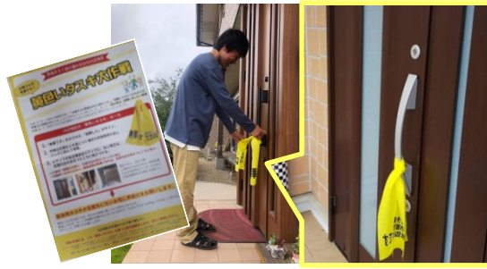
川辺地区の防災訓練で、掲げることで一目で安否が確認できる「黄色いタスキ大作戦」が行われました。川辺地区全世帯の60%以上が参加！関心の高さがうかがえます。