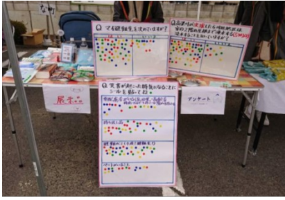
まちづくり主催の「冬まつり」で「川辺復興プロジェクトあるく」が行った防災に関するアンケートの様子。