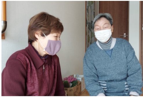
平成26年3月に、地域の住民の方に行った服部地区の 気になることのアンケートの結果から、この見守り・ 支え合い活動は始まりました。

服部地区見守り支え合い活動の五カ条。 小地域ケア会議の開会前に毎回唱和 しています。