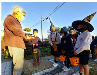
「トリックオアトリート」「お菓子をくれなさいたすらすらすぞ。」おばあは子供たちのためにお菓子配りの役を、子どもたちは一人暮らしのおばあを励ましに。

PTA有志、地区社協、地域のボランティア等、事業に共感した方がお手伝い。「大変じゃけど楽しいで。」