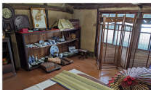
▲サロン会場の2階の屋根裏は、歴史を感じさせるレトロな雑貨がずらり。この秘密の小部屋も昭和の家の白樺です。