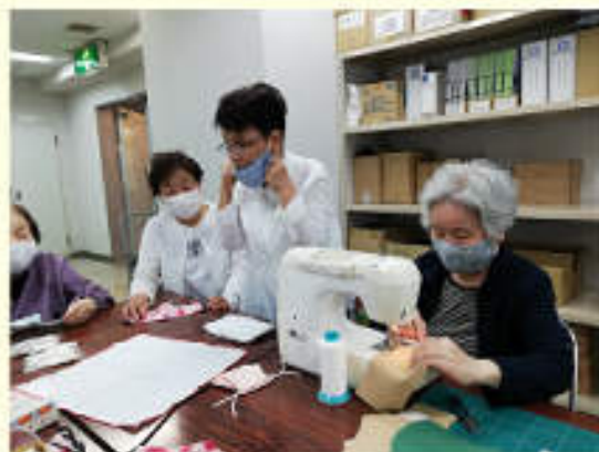
▲マンションでの新しい交流の仕組み 「エグゼ友の会」

倉敷市では地域福祉基金を創設し、ボランティア団体が、高齢者、障がい者、子育て中の親子などに対して行う保健福祉に関わる活動を助成しています。