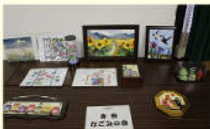
手芸等の作品展示