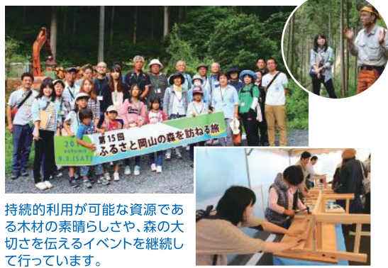
持続的利用が可能な資源である木材の素晴らしさや、森の大切さを伝えるイベントを継続して行っています。

これから本格的な人口減少社会を迎える中、中小企業は人手不足により事業の継続すら危うくなる状況が迫っています。エコアクション21の活動を通じた環境コミュニケーション、環境負荷の低減によるコストダウンや働き方の改革は、今後消費者だけでなく、就職先として選ばれる、重要な企業評価の指標にもなるのではないのでしょうか。