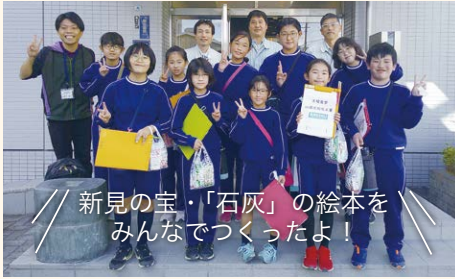
新見の宝・「石灰」の絵本を みんなでつくったよ！ 新見市立野馳小学校 6年生の皆さん (新見市)

今年のテーマは「想いの源(みなもと)」。 源流のまち・新見に集い、若者たちの“はじめの一步”に心を寄せてみる。