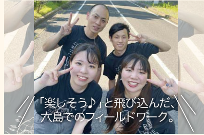
「楽しそう♪」と飛び込んだ、 六島でのフィールドワーク。 岡山学院大学 平野研究室 チーム4年生の皆さん (活動フィールド/笠岡市六島)